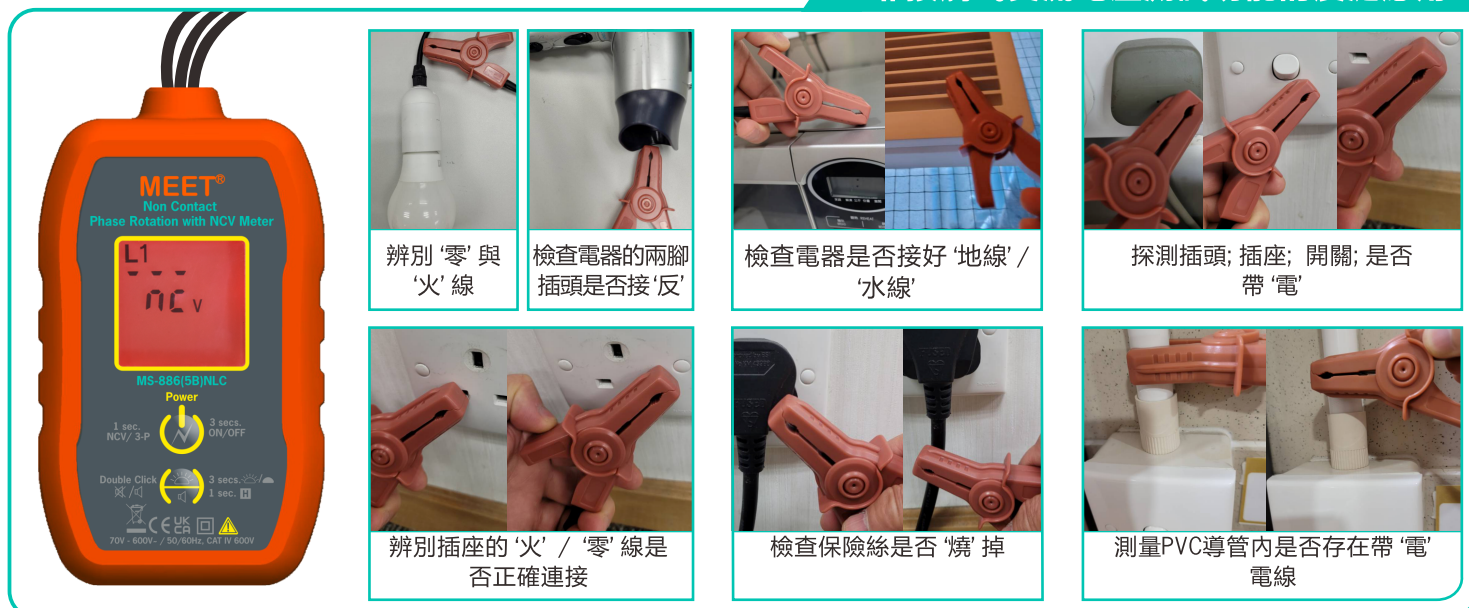
辨別 '零' 與 '火' 線