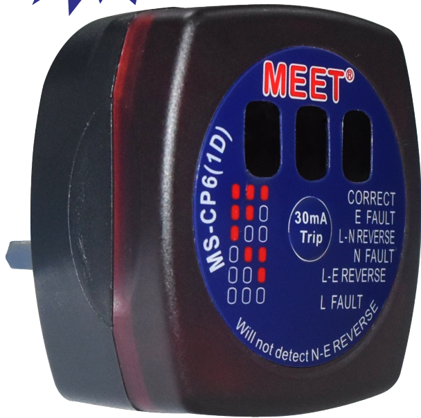
型號 : MS-CP6(1D)